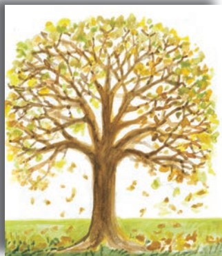
δέντρο που ρίχνει τα φύλλα του

Γράφουμε λίγα λόγια για το πώς κατορθώνουν αυτά τα φυτά να ζουν και να αναπτύσσονται στο περιβάλλον τους.